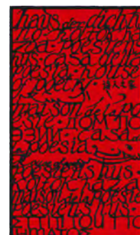
Maison de la poésie Rhône-Alpes