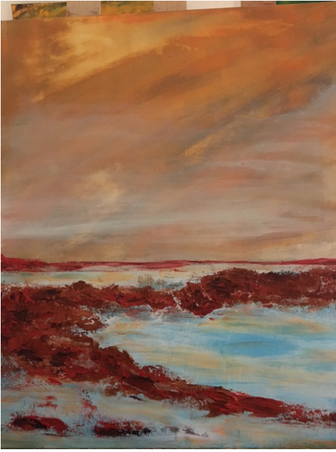
Acrylique d'Annie Coudène

Avec les éditions Jas sauvages, cultivons la foi spirituelle ou humaniste dans tous ses dialogues !