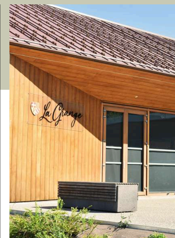
La salle La Grange

La salle La Grange est la salle communale de Lucinges. Elle accueillera une partie des exposants du salon ainsi que le Poématon.