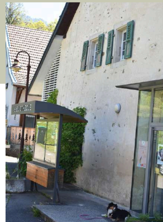
La Bibliothèque Michel Butor

Située au cœur du village, la bibliothèque offre un espace de convivialité pour tous les publics. Elle dispose notamment d'un fonds dédié aux œuvres d'édition courante de l'écrivain Michel Butor.