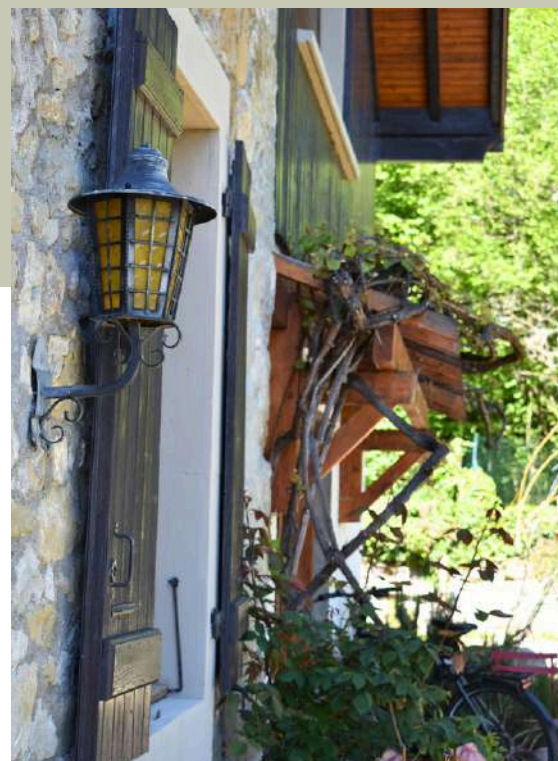
La maison Michel Butor

Nommée A L'Écart par l'écrivain lui-même, la bâtisse a pour mission d'accueillir des artistes en résidence. Le bureau de l'auteur a été laissé intact et un espace muséographique dédié à Michel Butor a été installé au rez-de-chaussée. Ces deux espaces sont ouverts au public.