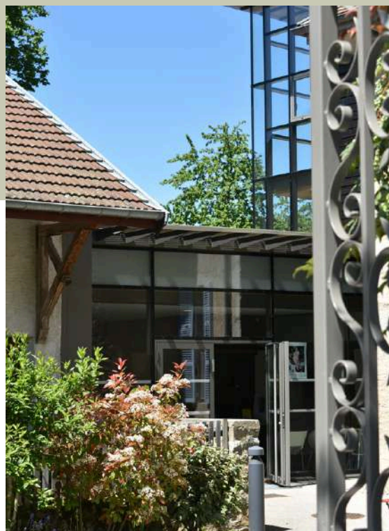
Le Manoir des livres

Le Manoir des livres est un espace de conservation et d'exposition dédié aux livres d'artiste qui a ouvert ses portes à Lucinges, en Haute-Savoie, après plusieurs années de travaux. Il tient son nom et son origine de l'installation de Michel Butor sur la commune en 1989.